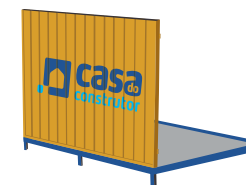
Instale a primeira lateral