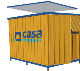
Instale o teto