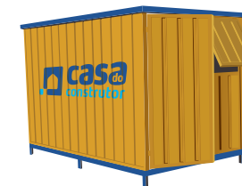
Instale a frente