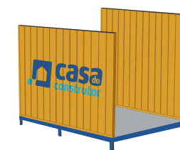
Instale a segunda lateral