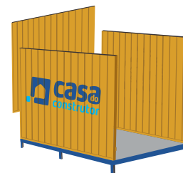
Instale a terceira lateral