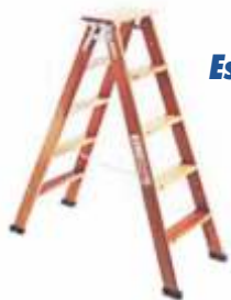
Escada de Abrir (Pintor)